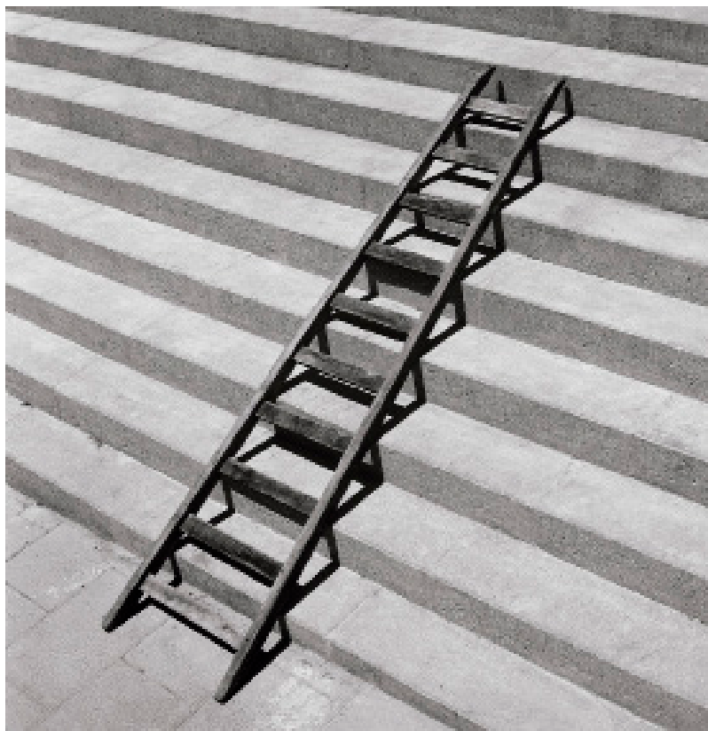
© Chema Madoz, S/T, 1990 Col·lecció Foto Colectania

Com expliquem allò que imaginem? Com representem les nostres emocions amb una imatge? Com fotografiem el que ha de venir? Què us suggereix aquesta fotografia?